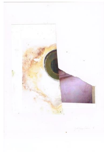
Seneca III, 2016 Collage op papier 26.2 x 28.2 cm © Vincent Geyskens