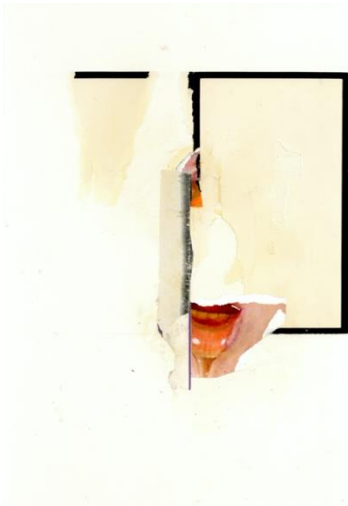
Rees Mogg II, 2018 Collage op papier 40 x 30 cm Privé collectie

Voor zijn collages vertrekt Geyskens van bestaande beelden die een duidelijke functie hebben, namelijk advertenties en campagnebeelden. De erotische of politieke beelden die hij uitscheurt, hebben de functie om te overtuigen, om op te winden. Door het beeld brutaal te verknippen en te plooiën, maakt hij zich het beeld eigen en schept hij een afstand met het originele beeld. Het worden nieuwe composities die de manier waarop we eerst naar die beelden en afbeeldingen keken verandert.