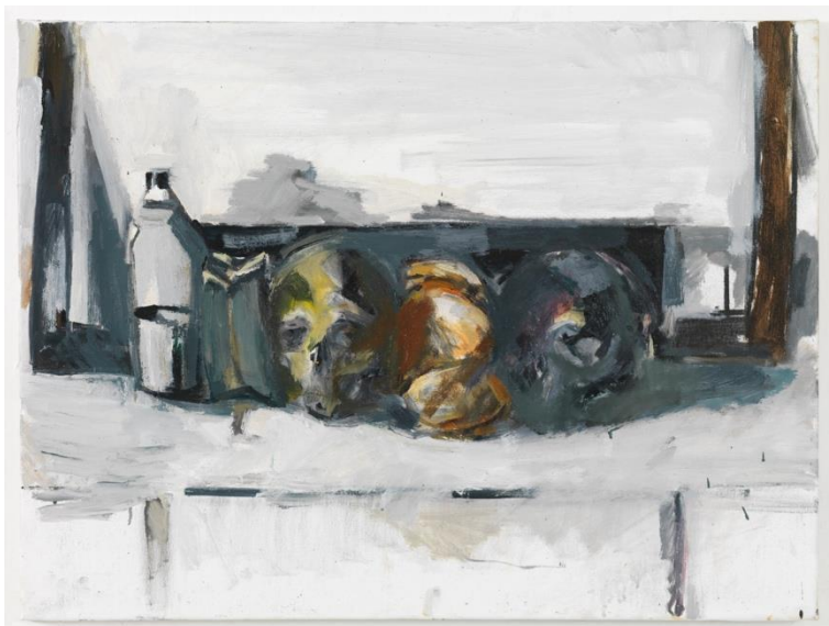
i conformisti, 2020 Olieverf op doek 60 x 80 cm

Voor zijn stillevens zet hij licht en donker in om een gevoel van leegte en openheid te creëren.