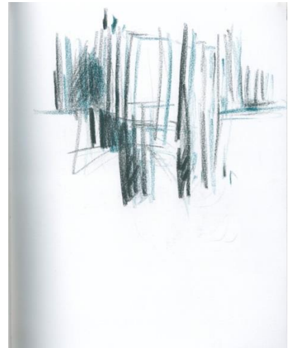
ARB, pierre noire krijt, grafiet,... op papier, 21 x 39,7 cm