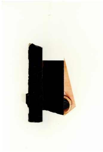
Angst, 2018 Collage op papier 40 x 30 cm © Vincent Geyskens